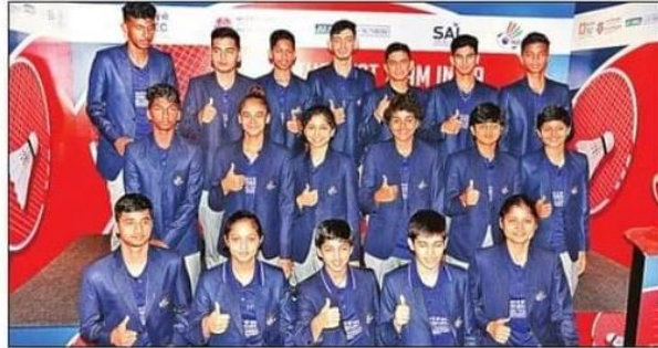
बैडमिंटन एशिया जूनियर चैंपियनशिप के लिए जाने वाले खिलाड़ी।