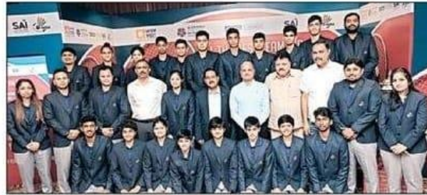
इंडोनेशिया में होने वाली बैडमिंटन एशिया जूनियर चैंपियनशिप में भारत का प्रतिनिधित्व करने वाली टीम तैयार।

पंचकूला, 2 जुलाई : पंचकूला के ताऊ देवीलाल स्टेडियम में दो सप्ताह के कठोर ट्रेनिंग कैंप से गुजरने के बाद 18 सदस्यीय भारतीय टीम 7 से 16 जुलाई तक इंडोनेशिया में होने वाली बैडमिंटन एशिया जूनियर चैंपियनशिप के लिए रवाना होने के लिए तैयार है। टीम की तैयारियों को मजबूती प्रदान करने के उद्देश्य से आयोजित 14 दिनों के ट्रेनिंग कैंप को भारतीय बैडमिंटन के डेवलपमेंट प्रोग्राम को मजबूत करने के लिए भारतीय खेल प्राधिकरण (साई) और भारतीय बैडमिंटन संघ (बीएआई) के साथ विद्युत मंत्रालय के अंतर्गत आने वाली एक महारत्न कंपनी- आरईसी लिमिटेड द्वारा सपोर्ट किया गया है। भारतीय