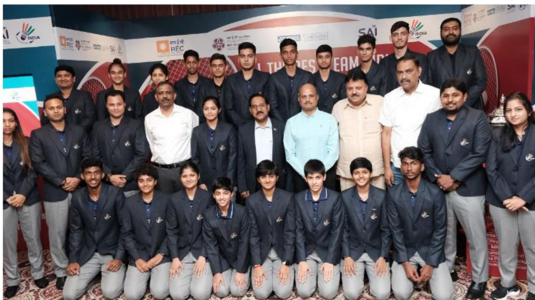
The Indian squad for the upcoming Badminton Asia Junior Championships along with the support staff and officials during the send off ceremony in Panchkula on Sunday.

In the group stage, India is pitted in Group C along with Malaysia, Bangladesh and Hong Kong. The top two teams from each group will qualify for the knockout stage. In the past, India has won two gold medals, one silver and a bronze.