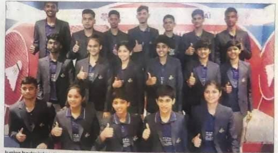
Junior badminton team members during a send-off ceremony in Panchkula on Sunday.