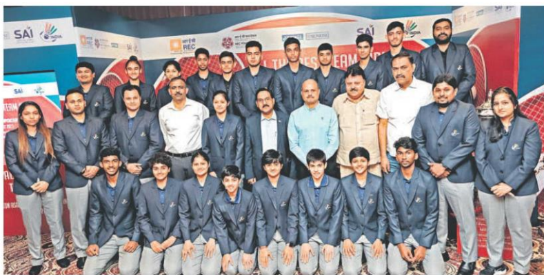
The Indian squad for the upcoming Badminton Asia Junior Championships along with the support staff and officials during the send off ceremony in Panchkula on Sunday.

The continental badminton championship will be held at Yogyakarta, Indonesia