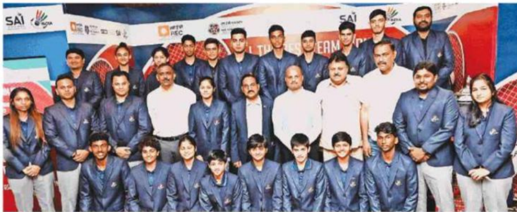
बैडमिंटन की एशिया जूनियर चैंपियनशिप में हिस्सा लेने वाली टीम, स्टाफ और एसोसिएशन के पदाधिकारी