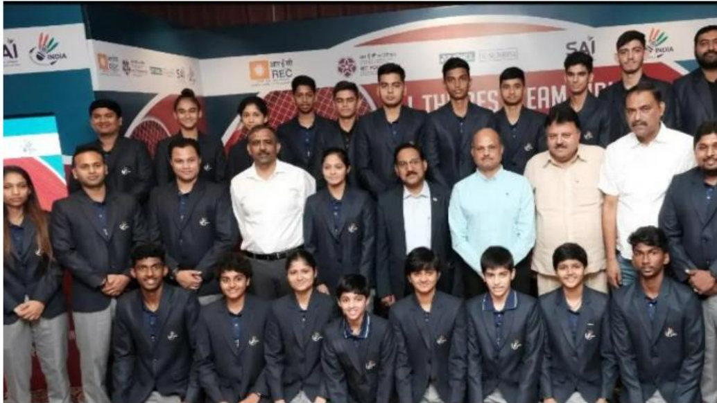
Squad for Badminton Junior Asia Championships

Following a rigorous two-week preparatory training camp, an 18-member Indian badminton team will leave for Indonesia on Tuesday to participate in the Junior Asia Championships