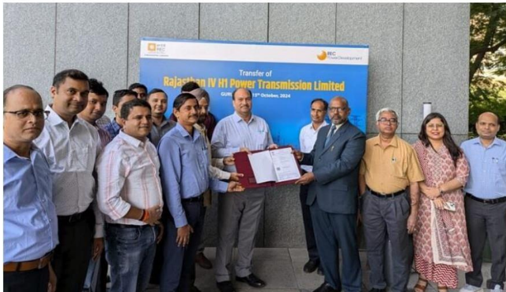
RECPDCL hands Over Rajasthan-IV H-1 Power Transmission Limited to M/s Power Grid Corporation of India Limited

REC Power Development and Consultancy Limited (RECPDCL), a wholly owned subsidiary of REC Limited, the Maharatna CPSU under the aegis of Ministry of Power, handed over a project specific SPV (Special Purpose Vehicle). viz, Rajasthan-IV H-1 Power Transmission Limited to M/s Power Grid Corporation of India Limited (PGCIL) on 15 th October 2024 at Gurugram.