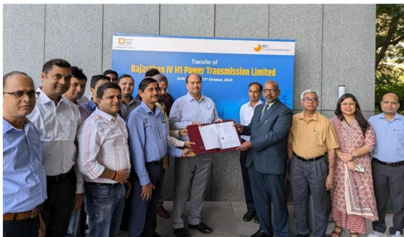
RECPDCL dignitaries handing over Rajasthan-IV H-1 Power Transmission Limited to Power Grid Corporation of India Limited in Gurugram on Tuesday.

JAMMU, Oct 15: REC Power Development and Consultancy Limited (RECPDCL), a subsidiary of REC Limited under the Ministry of Power, has transferred the Rajasthan-IV H-1 Power Transmission Limited project to Power Grid Corporation of India Limited (PGCIL).