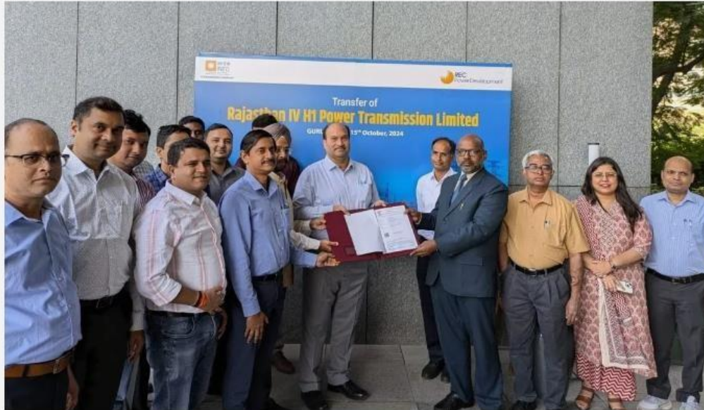
RECPDCL Hands Over Rajasthan-IV H-1 Power Transmission Limited

REC Power Development and Consultancy Limited (RECPDCL), a wholly owned subsidiary of REC Limited, the Maharatna CPSU under the aegis of Ministry of Power, handed over a project specific SPV (Special Purpose Vehicle). viz, Rajasthan-IV H-1 Power Transmission Limited to M/s Power Grid Corporation of India Limited (PGCIL) on 15th October 2024 at Gurugram.